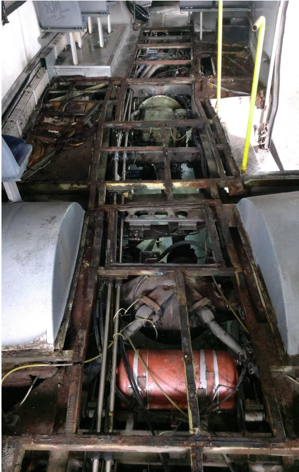
Сл. 1. Приказ деформације на шасијским елементима као последица бочног удара